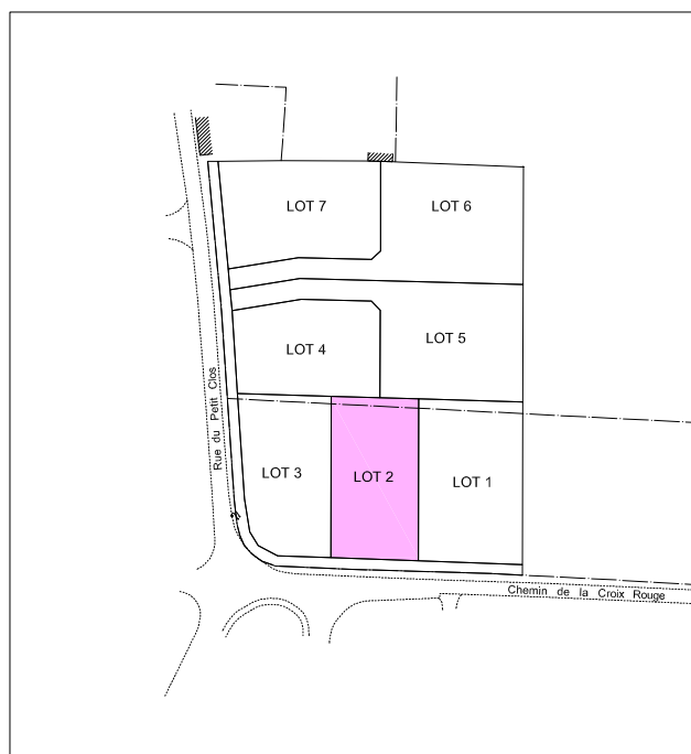
LOCALISATION DU LOT